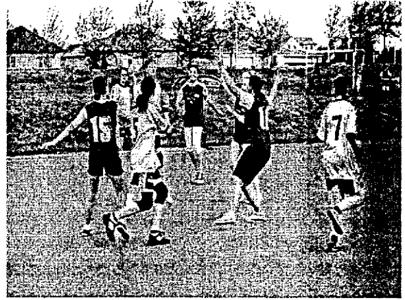
Kézilabda az egyik kedvenc játékunk