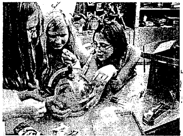
Szerkesztés gömbön matematikaórán